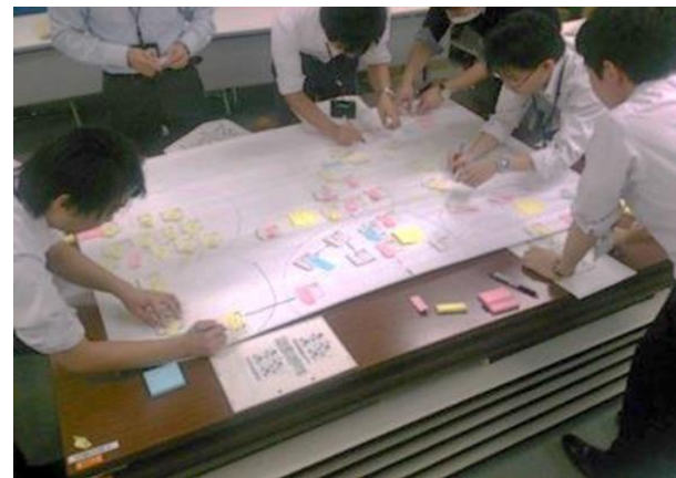
意見・アイデアの整理